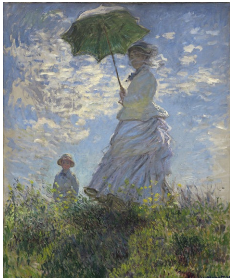
Женщина с зонтиком (Мадам Моне с сыном).

Главное для импрессионистов — свет; их красочные полотна, напоминающие яркие этюды, буквально пронизаны им. Вдохновителями направления, зародившегося в середине 1860-х годов, стали его предшественники: английская пейзажная живопись и реализм, особенно барбизонская и гагская школы. Самыми ранними импрессионистами можно назвать Клода Моне (1840–1926), Пьера Ренуара (1841–1919), Камилы Писсарро (1830–1903) и Берту Моризо (1841–1895). Эти художники занимались теорией цвета, использовали новые технологии, фотографию и синтетические пигменты. Их любимыми сюжетами были пейзажи и сцены из современной жизни, но главными героями всегда оставались свет и состояние природы в разную погоду. Смелые мазки отражали ее изменения: импрессионисты почти всегда работали на природе, а не в мастерских. Многие из них использовали технику алла прима (от ит. a la prima — «в один прием»), когда картина писалась за один сеанс и художнику не нужно было ждать полного высыхания красок для наложения нового слоя.