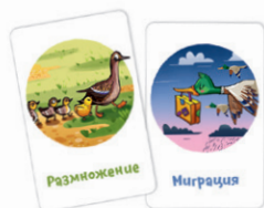
Рис. 3. Эти карты похожи тем, что на них птицы.

Если ходящий игрок предлагает совсем негодную ассоциацию, другие игроки вправе не принять её. В этом случае ходящий должен предложить другой вариант или забрать обратно выложенную карту и пропустить ход.