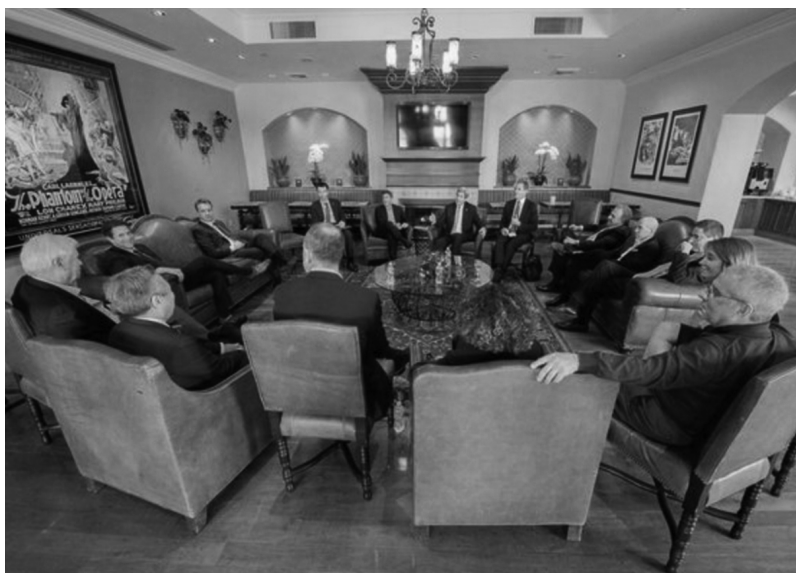
Встреча госсекретаря Джона Керри с главами голливудских студий (фото из Twitter-аккаунта политика)

успешно стали проходить законопроекты, лоббируемые Американской ассоциацией кинокомпаний, а также гильдиями актеров, режиссеров, сценаристов и т. д. В декабре нижняя палата конгресса одобрила Comprehensive Trade Negotiating Authority Act (HR 3019), упрощающий процедуру заключения торговых договоров на высшем уровне. Затем последовало принятие Independent Film and Television Production Incentive Act (HR 3131), направленного на поддержку кинопроизводства с привлечением капитала американских компаний 8 . Федеральная комиссия по связи не стала ужесточать требования по ограничению доступа к кабельным каналам эротического содержания и правила относительно присутствия насилия в аудиовизуальной продукции, предназначенной для детей. Во всех этих случаях медиаконцерны сохранили много денег, а также получили возможность больше заработать 9 .