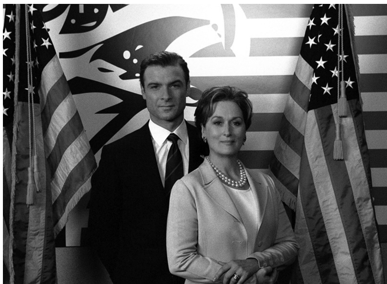
Кадр из фильма «Манчжурский кандидат» (2004)

Перед президентскими выборами 2004 г. жена 42-го президента, занимавшая на тот момент сенаторское кресло, считалась одним из наиболее вероятных соперников действующего главы государства на выборах, но не стала выдвигаться. За три месяца до голосования кинокомпания Paramount, ранее организовавшая встречу советника Джорджа Буша-младшего с кинобоссами Голливуда, выпустила в американский прокат