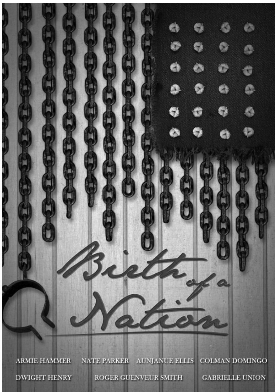
«Рождение нации» (2016)