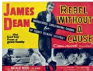
Бертрам, без причины (1955)

ОСНОВНЫЕ ИМЕНА: ХИКОКС РИЧ • ЭРИК РОМЕР • НАУРА СКОССА • ДЖИМ КАУТ • ДЖИМ КАХИЛАН • ЖАКЕС ОТОУ • ФРАНКО ДЖИЛЛАДИ • ГРЕГА БЕРГЕР