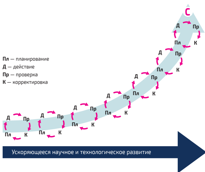
Рис. 5.1. Цикл Деминга в ускоряющихся средах

В целом можно сказать, что в новом режиме постоянных изменений цикл Деминга необходимо существенно образом скорректировать. Впрочем, если применять его должным образом, он может быть по-прежнему актуален. Для этого следует внутри компании использовать непрерывно вращающееся «колесо» контроля качества. Это «колесо» должно быть связано с основными драйверами потенциальных подрывных инноваций. Мы должны мыслить категориями «смешанного роста» и «подрыва». Но даже в этом